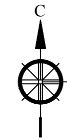
Ситуационный план. М 1:5000.